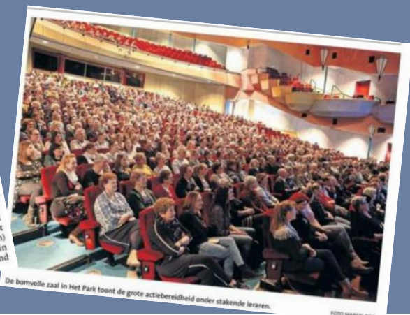
De bomvolle zaal in Het Park toont de grote actiebereidheid onder stakende leraren.