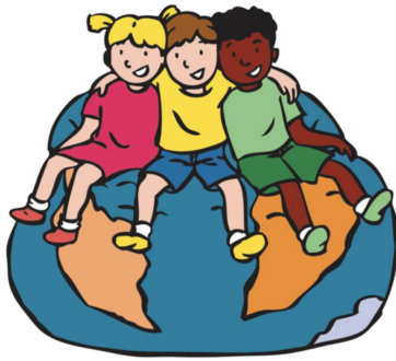
We horen bij elkaar

We werken tijdens de eerste weken aan blok 1: We horen bij elkaar.